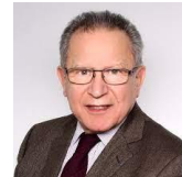
Paul-Louis NETTER , président du tribunal de commerce de Paris